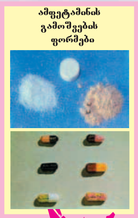
ამფეტამინის გამოშვების ფორმები

ინექცია - ზოგიერთი მომხმარებელი მას შპრიცით იღებს, რაც ძალზე საშიშია. ამ შემთხვევაში დიდია გადაჭარბებული დოზის მიღების ალბათობა, რადგან დოზის სიძლიერე ზუსტად ადამიანმა არასოდეს არ იცის. გულმა შეიძლება ვეღარ გაუძლოს. თუ რამდენიმე ადამიანმა გამოიყენა ერთი და იგივე შპრიცი, არსებობს ისეთი ინფექციების საშიშროება, როგორცაა შიდსი, B ან C ჰეპატიტი.