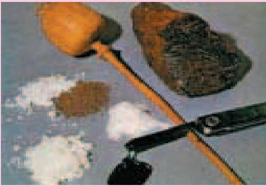
ობიუმის ყაყაჩოს პროდუქტები

ჰერონზე თავის განებება ძალიან ძნელია. თუ მომხმარებელი უცხად ანებებს თავს, განიცდის ფსიქოლოგიურ და ფიზიკურ გამოვლინებებს: